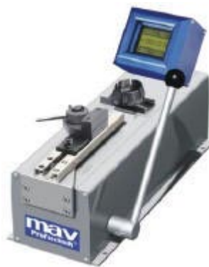
CT 50 mit SG 40 und MK-8

Druckkraftmessungen, z. B. bei Einsteck- und Ausdrückprüfungen Anzeigebereich 0-500 N, mit einer Messwertaufösung von 0,5 N.